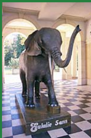
L'éléphant Eulalie, symbole du Muséum et grand ami des petits comme des grands